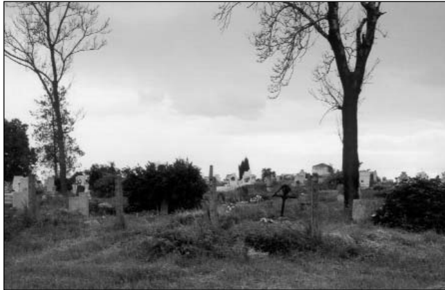
Temető részlet 2001-ben.

sző részén egy jókora darab már a XIX. században betelt, amit felszámoltak és ma mezőgazdasági termelésre használnak. Ez a terület volt a harangozó illetményföldje, belőle a sírköveket régen elhordták. A temető talaja homokos humusz, alatta vastag, ke-