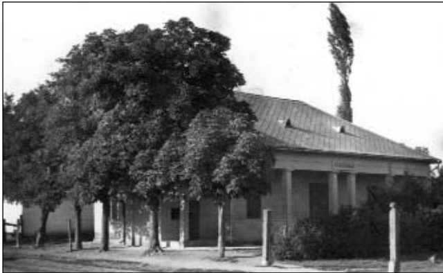
A kultúrház és mozi 1962-ben.

Népkönyvtár, népház nem volt a faluban. Rádiója az 1930-as években mindössze 16 családnak volt. Újság csak a tehetősebbeknek járt. 7