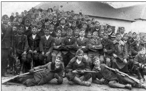
Leventék a tűzoltószertár előtt.

A fiatal fiúk, férfiak vallásos és nemzeti szellemű nevelésére, valamint testedzésére az iskolán kívül is nagy gondot fordítottak. Ennek egyik szervezete a cserkész, a másik a leventemozgalom volt. A cserkészet Magyarországon 1912-ben jelent meg, de csak az I. világháború után terjedt el. Programja szerint a cserkészet lelkiileg kiegyensúlyozott és vallásos, fizikailag erős, életrevaló és gyakorlatias fiúkat akart nevelni. Tagjait, akik egyenruhát viseltek, ennek érdekében katonai szervezett-