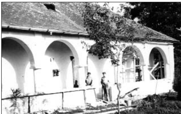
Az egészségház 1962-ben.