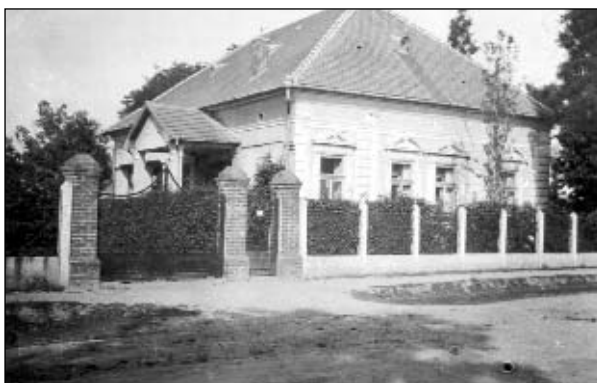
A mai művelődési ház épülete 1940-ben.

1954-ig, amíg külön kultúrotthona nem volt a falunak, a gépállomás nagy terme volt a község kulturális megmozdulásainak székhelye. A