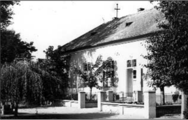
Az orvosi rendelő 1962-ben.

(HOM. HTD. 79. 676. 1. Ferencz Klára, 1962.)