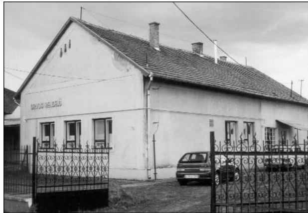
Az orvosi rendelő 2001-ben.

Az orvosi rendelőt 1990 és 1994 között az orvosi ellátás tárgyi feltételeinek javítása érdekében kibővítették, 1998 után az egészségházat, az