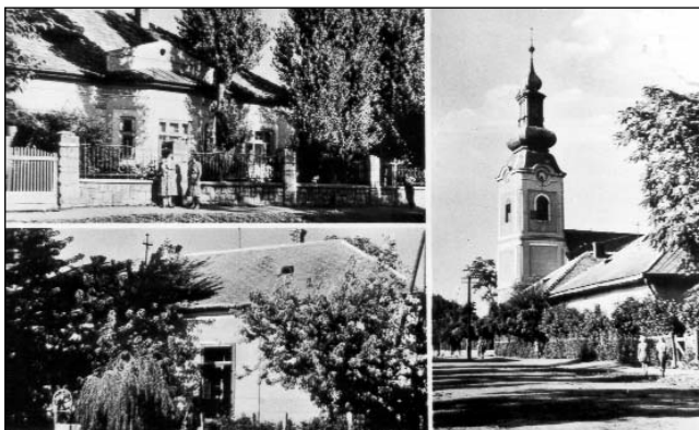
Képeslap a községről az 1950-es évekből.

Az I. világháború után ezek a ruhadarabok lassan eltűntek, az öltözködés városiasodott. Előfordult, hogy az 1930-as években előadott népszínművekhez jelmeznek már egyáltalán nem vagy alig találtak régi ruhadarabot a faluban. A papi ember ünnepkor és a vásárnap templombajáráskor mindig odafigyelt ruházataira. Úgy tartották, hogy az itteniek túlon túl is szeretnek öltözködni. Nagyobb ünnepek előtt (karácsony, húsvét, pünkösöd, stb.) dívott a ruha- és cipővásárlás. A helyiek az öltözködés mellett lakásuk tisztán tartására is ügyeltek, azt is szerették csinosan tartani. Csaknem mindenütt volt egy mindennap, s egy, csak ünnepek alkalmával használt szoba, melynek bútorzata is előkelőbb volt. 21