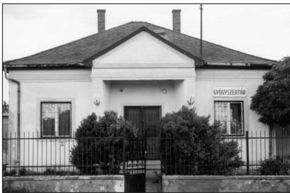
A gyógyszerház 2001-ben.