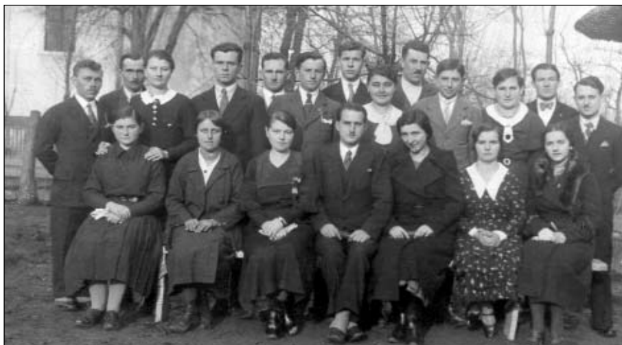
A színtárszócsoport 1937-ben.