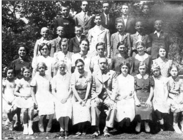
A táncanfolyam résztvevői 1939-ben.

össze a falu lányából, fiaiból, diákjaiból álló színtársulatot. Ő tanította be az akkor népszerű műveket: Liliomfi, Sárgacsikó, Falu rossza, Piros bugyellár stb. Időnként a szomszéd községben is felléptek. A színelőadások mellett a tánciskola tartozott a rendszeresen megtartott kulturális események közé. Kezdők és haladók részére Miskolcra szerződött tánc tanár járt ki táncórákat tartani. A zenét egy szál cigány zenész szolgáltatta. A táncórákat a szegényes falusi gazdakör helyiségében tartot-